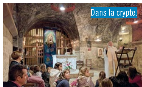
Dans la crypte.