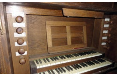
Détail de la console, avec les deux claviers superposés et les tirants de jeux (ou registres).