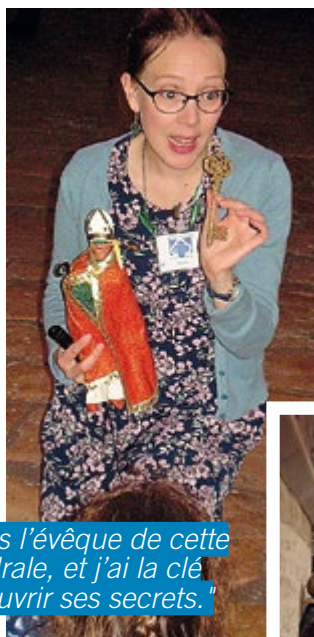
“Je suis l'évêque de cette cathédrale, et j'ai la clé pour ouvrir ses secrets.”