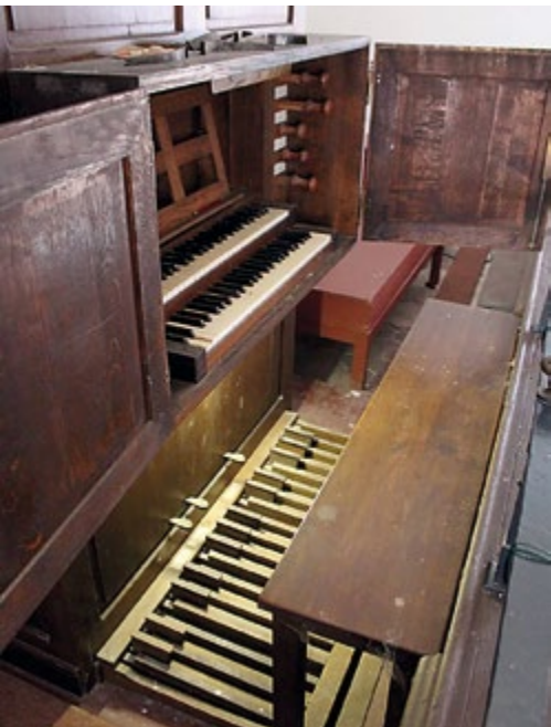
La console, place de l'organiste : banc, claviers et pédalier.

>>> comme à la musique. Pour aider à cette restauration, l'ARO organise des manifestations musicales, plusieurs fois par an. Mais les bénéfices de ces concerts sont, bien sûr, insuffisants. C'est pourquoi l'ARO fait appel à la générosité de tous. Un document présentant les différentes possibilités de soutien est remis aux auditeurs au cours des concerts ou envoyé par mail.