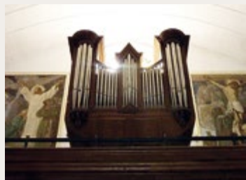
Le buffet d'orgue, installé sur la tribune au fond de l'église, avant son démontage.

L'orgue se distingue de tous les autres instruments de musique. Il est unique en son genre et exceptionnel par bien des aspects : instrument à vent puissant et complexe, souvent de grandes dimensions (il peut être monumental, aussi grand qu'une maison de plusieurs étages !), c'est le seul instrument qui se joue à la fois avec les mains (sur un à sept claviers superposés) et les pieds (sur un grand pédalier) dont les touches commandent le passage de l'air, envoyé par une soufflerie et emmagasiné dans les sommiers, vers des tuyaux de taille décroissante disposés par jeux, que l'on peut combiner les uns avec les autres, et qui ont chacun un timbre différent. L'orgue peut remplacer un orchestre à lui tout seul, mais les claviers de l'orgue restent muets et l'enfoncement d'une touche n'émet aucun son si aucun registre de jeu n'est tiré.