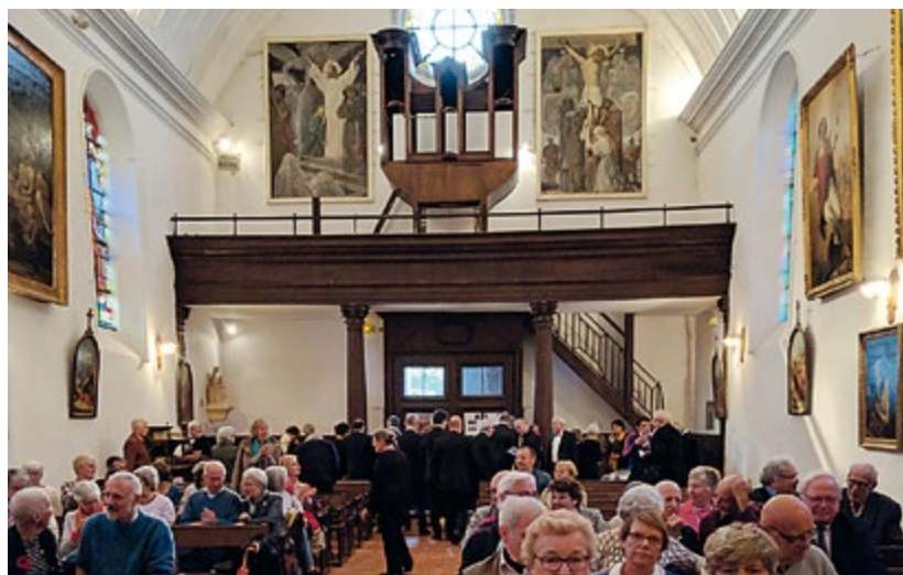
Concert "pour la renaissance de l'orgue" devant l'instrument entièrement démonté en vue de sa restauration.