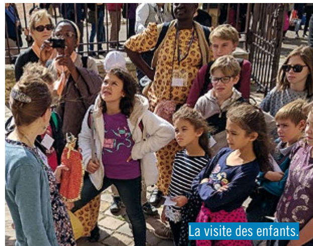
La visite des enfants